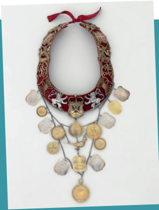
Chaîne de sire