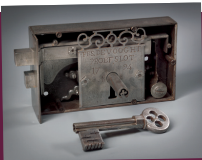
serrure en acier