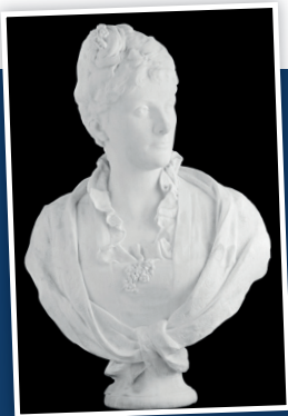
Buste d'Augusta Liedts