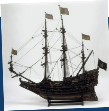
maquette van de Maagd van Gent