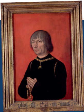
portret van Lodewijk van Gruuthuse